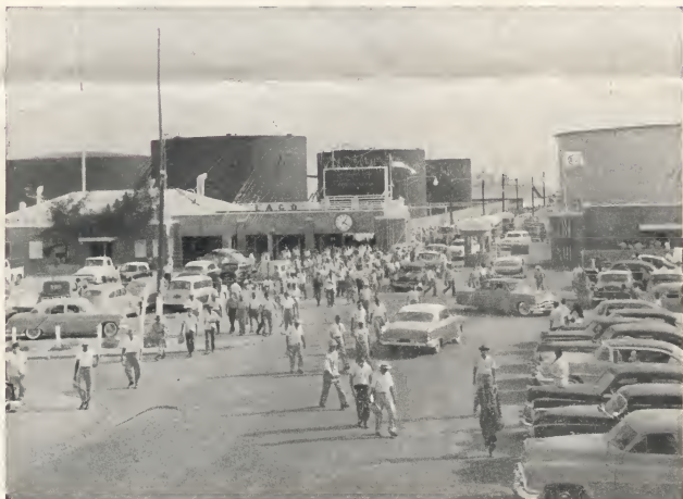
Aruba's Main Artery